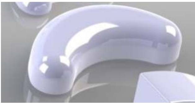
CA Power Grip 4 (FALA) y CA Power Grip 5 (FALI).

In this Newsletter, we are going to talk about the CA Power Grip 4 (Force Application Labial - FALA) and CA Power Grip 5 (Force Application Lingual - FALI), used to correct the torque in approximately 5°.