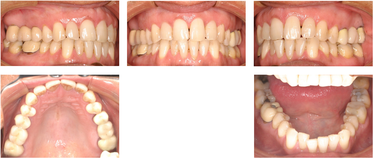
Fig. 59-62. Tratamiento de recidiva en la arcada inferior. Registros iniciales.