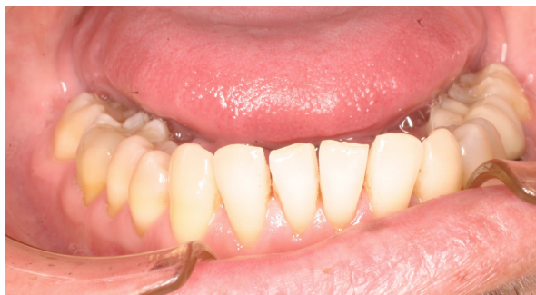
Fig. 15. Realización del stripping.