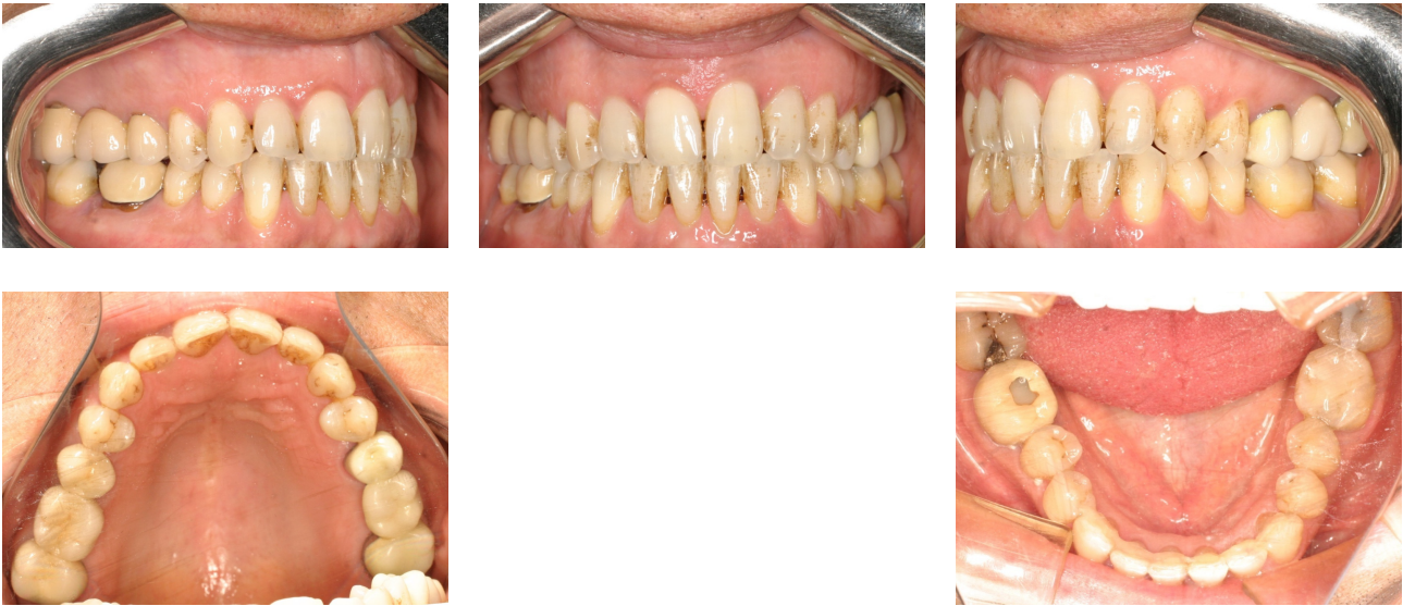
Figs. 64-68. Registros finales.