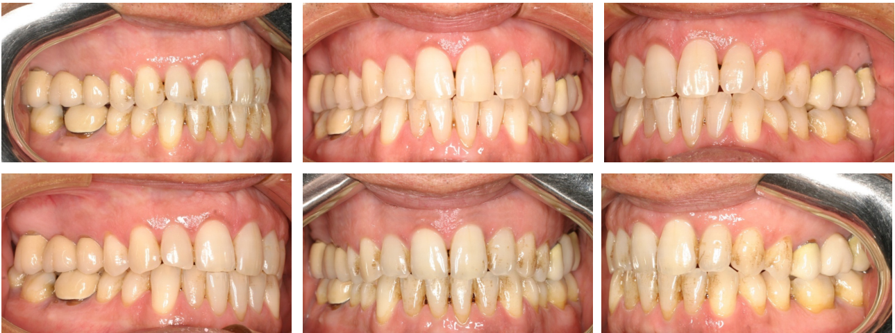
Figs. 69-74. Antes y después.