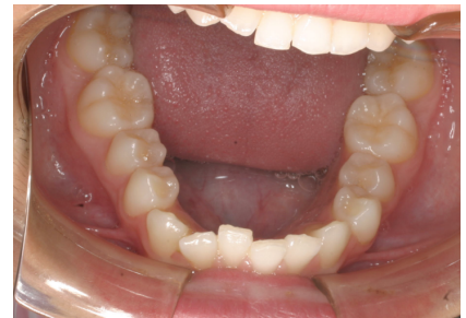
Fig.100-104. Tratamiento de apiñamiento y rotaciones en arcada superior e inferior.