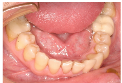
Figs. 10-14. Realización del stripping.