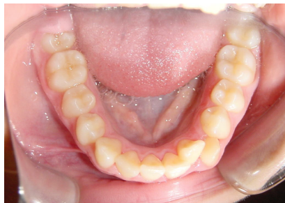
Figs. 92-95. Tratamiento de apiñamiento anterior en arcada inferior. Registros iniciales.