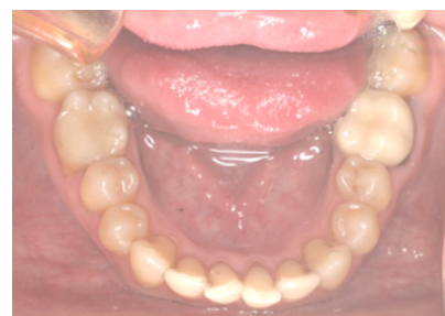
Figs. 1-5. Tratamiento de apiñamientos con la técnica de stripping progresivo. Registros iniciales.