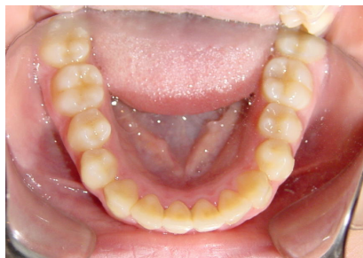
Figs. 96-99. Registros finales.