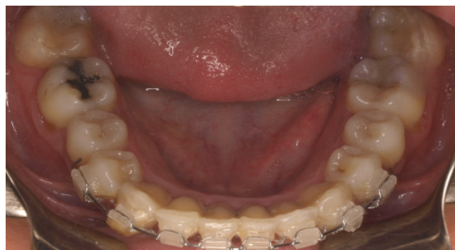
Figs. 90 y 91. Antes y después.