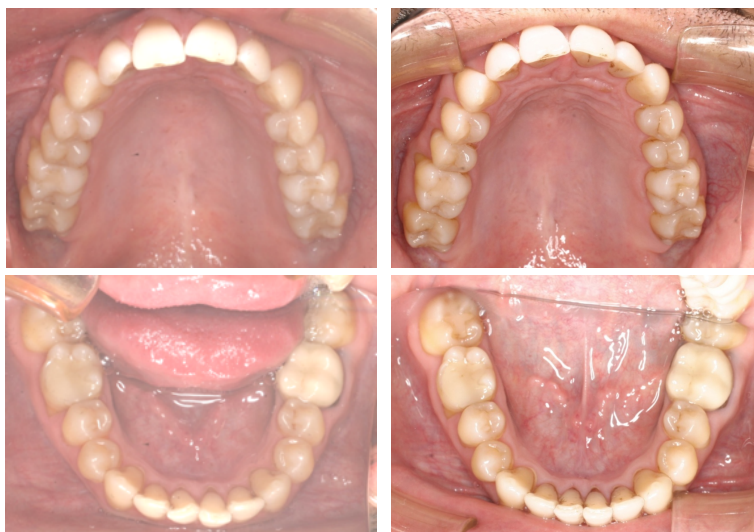
Figs. 55-58. Antes y después