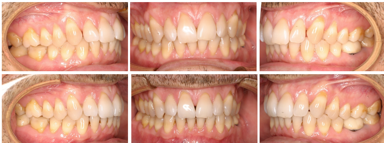
Figs. 49-54. Antes y después.