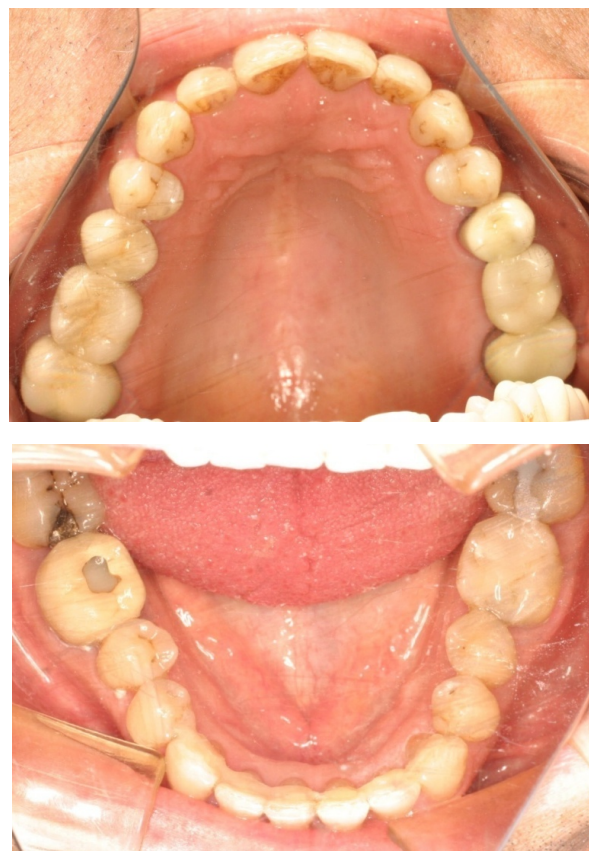
Figs. 75-78. Antes y después.