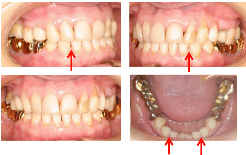
Figs. 135-138. Espacio entre 2-3.