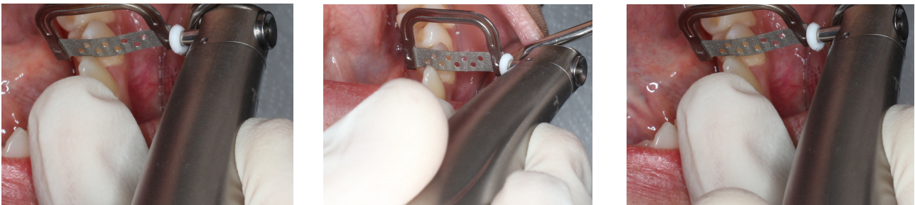
Figs. 128-130. Realización del stripping con el Echarri PST Set.