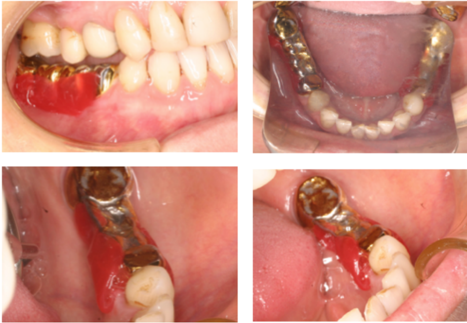
Figs. 124-127. Preparación con cera para toma de impresiones.