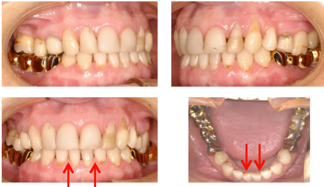
Figs. 139-142. Espacio entre 1-2.