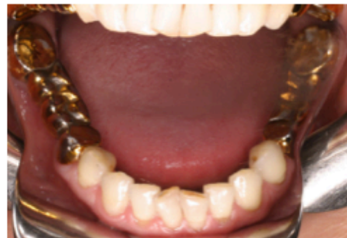
Figs. 112-119. Caso 01155. Presenta apiñamiento inferior. Tratado con la técnica de stripping progresivo. 10 pasos.