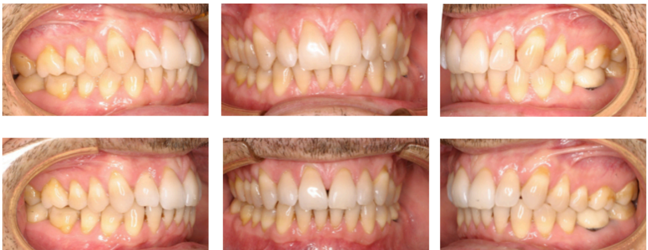
Figs. 52-57. Antes y después.