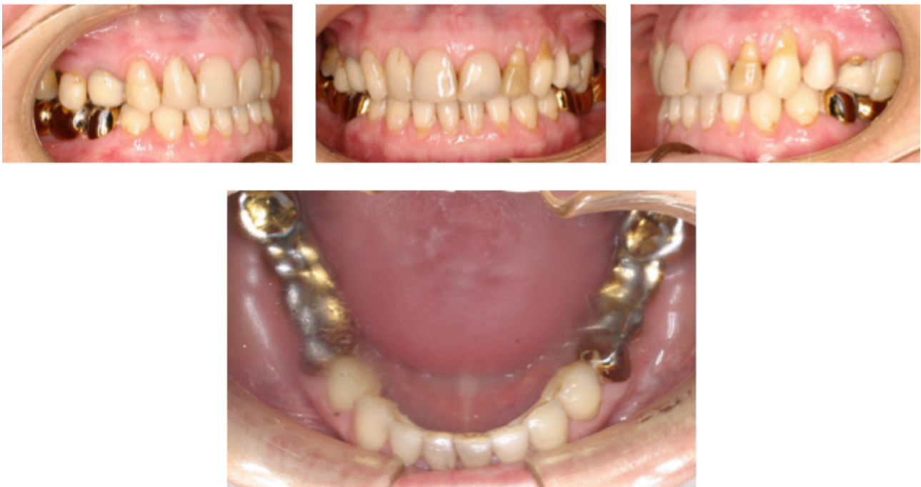
Figs. 143-146. Fotografías finales.