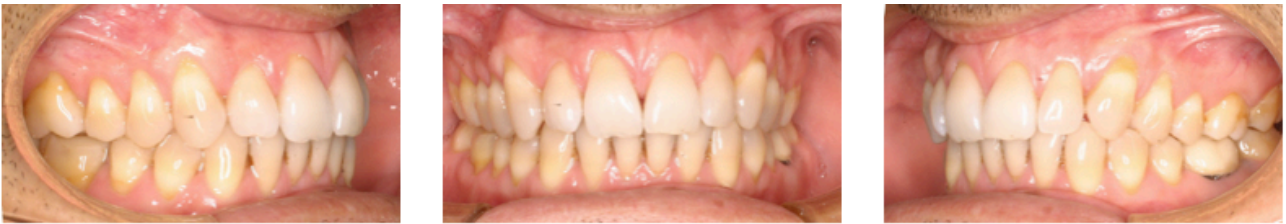
Figs. 27-31. Progress 3