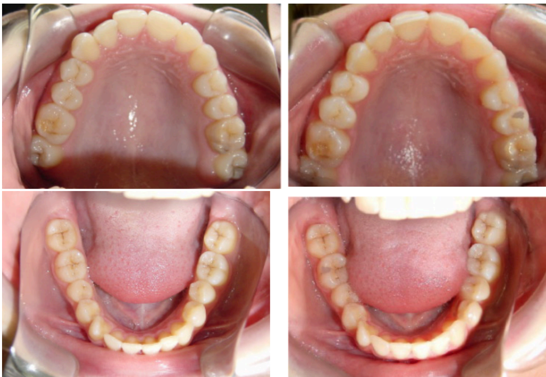
Figs. 108-111. Antes y después de 3 meses.