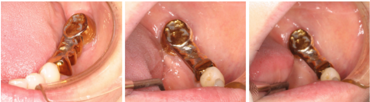
Figs. 121-123. Pónticos.