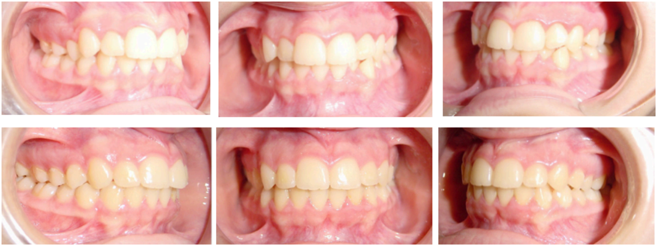
Figs. 72-77. Antes y después.