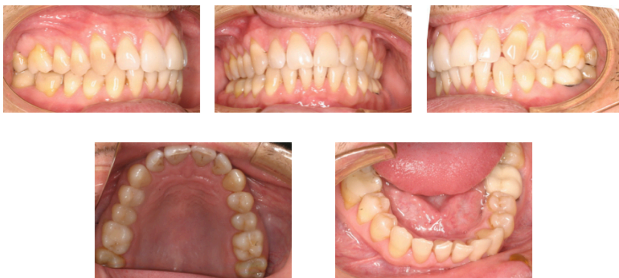
Figs. 12-16. Realización del stripping.