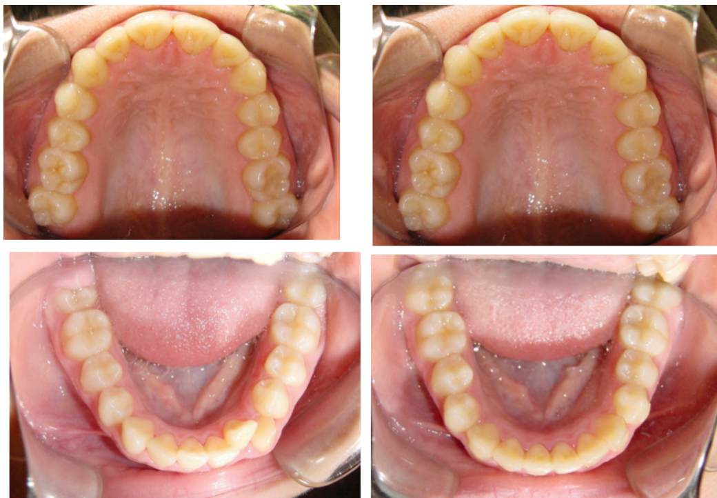
Figs. 77-80. Antes y después.