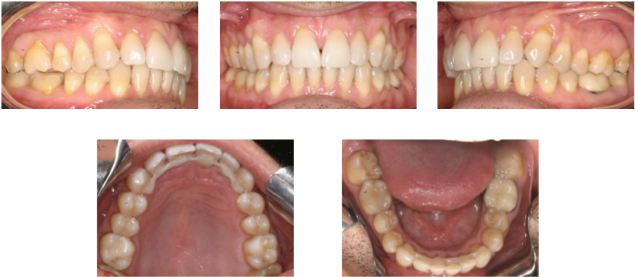
Figs. 47-51. Fase de retención.