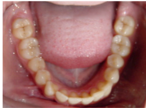
Figs. 81-88. Apiñamiento leve entre 12-11-21 y 43. Tratado con 3 pasos.