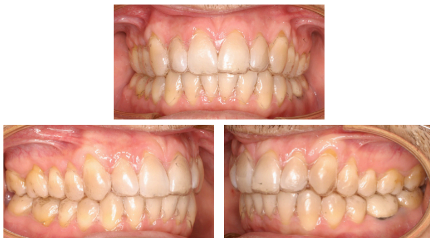
Figs. 9-11. El tratamiento en ambas arcadas se realiza con un CA® CLEAR ALIGNER de expansión transversal. Una vez obtenido el espacio, se continúa el tratamiento con stripping.