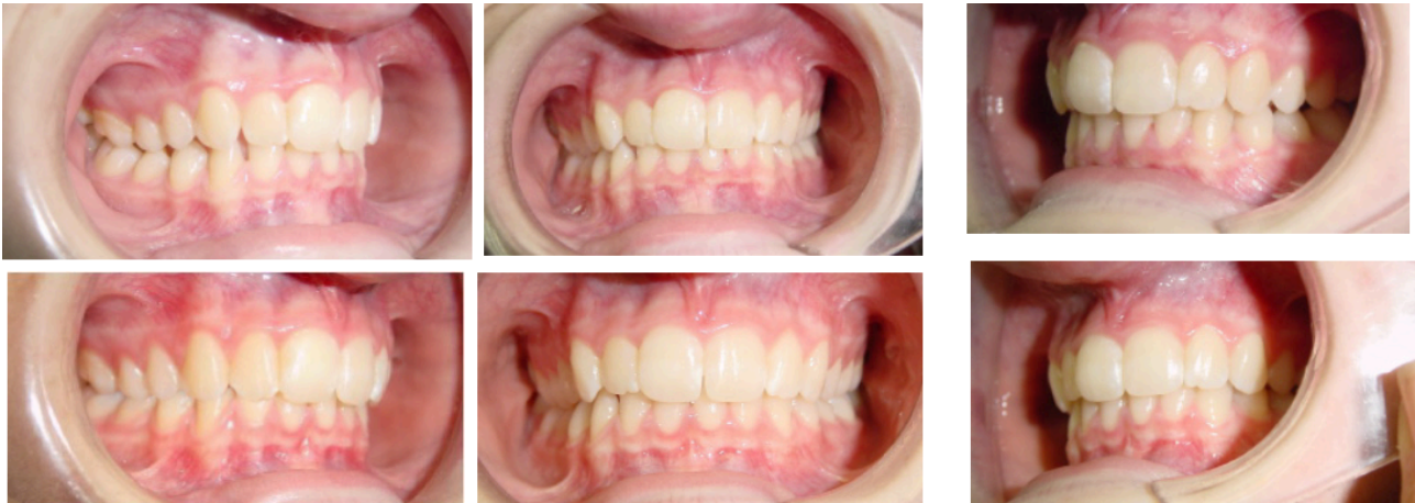
Figs. 102-107. Antes y después de 3 meses.