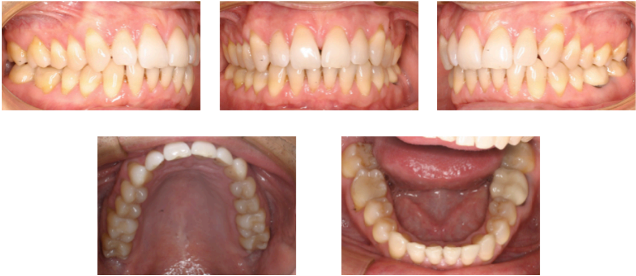
Figs. 37-41. Progreso 5