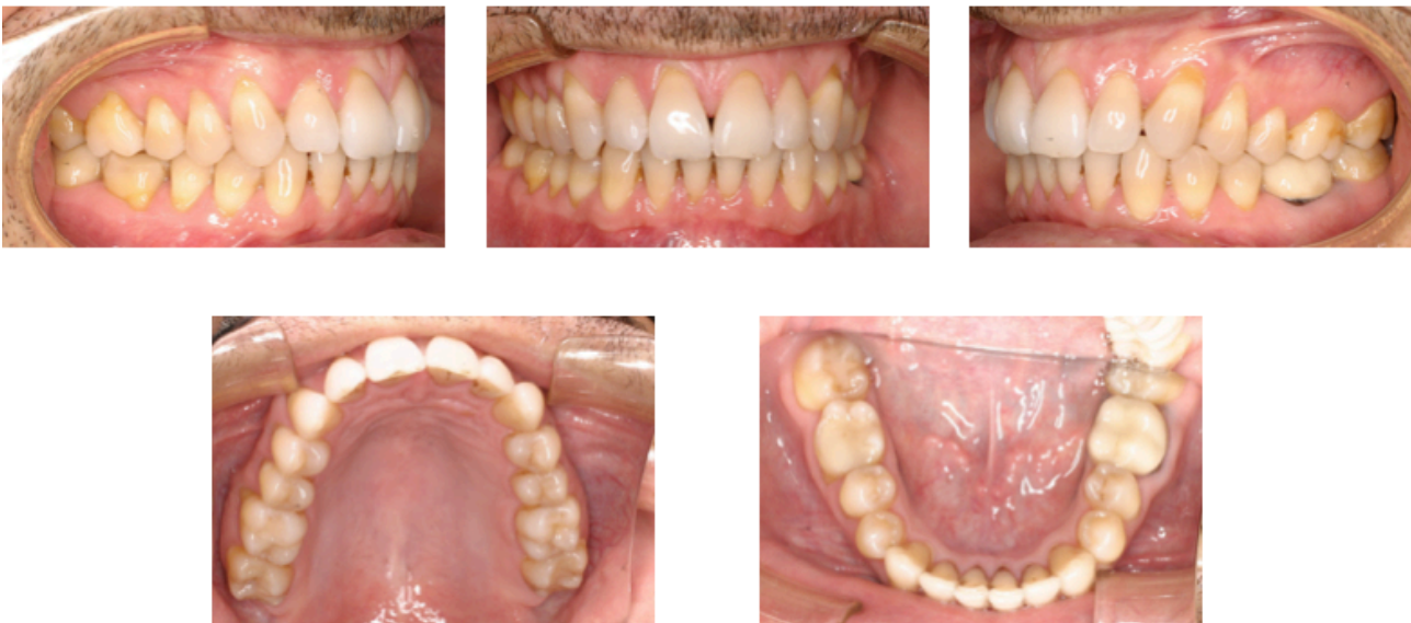
Figs. 42-46. Fotografías finales.