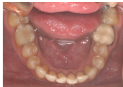
Figs. 1-8. Caso 01178B. Presenta apiñamiento. Tratado con protrusión y stripping.