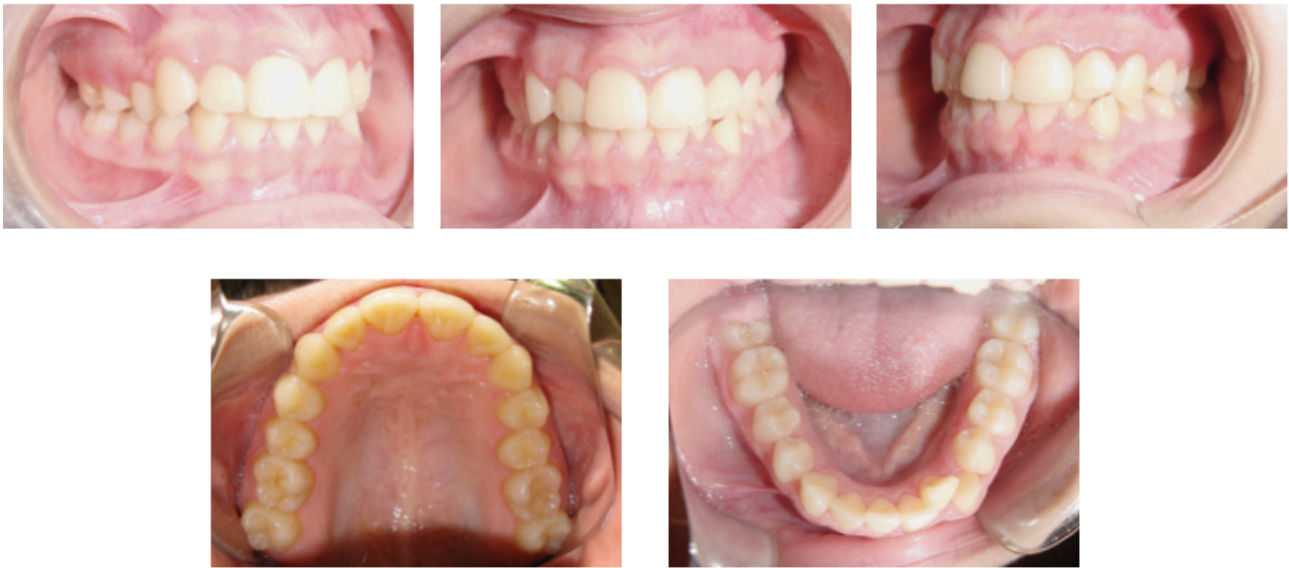
Fig. 62-66. Caso CE 0010. Presenta apiñamiento inferior. Tratado con stripping y 6 pasos en arcada inferior.