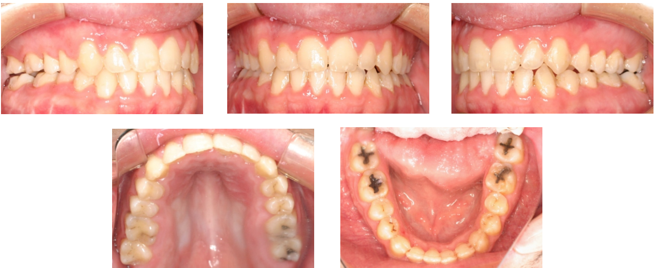
Figuras 44-48. Fotografías finales.