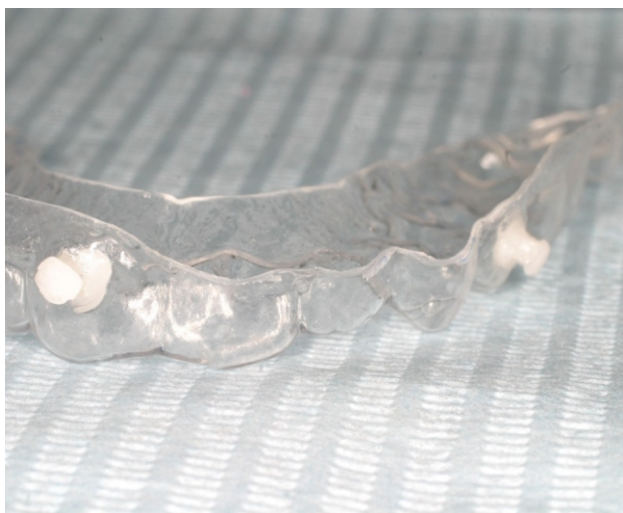
Figuras 38-39. CA Clear Aligner Forced extrusion con botones CA de plástico