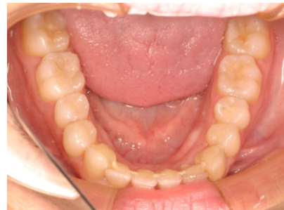
Figuras 16-20. Fotografías finales.