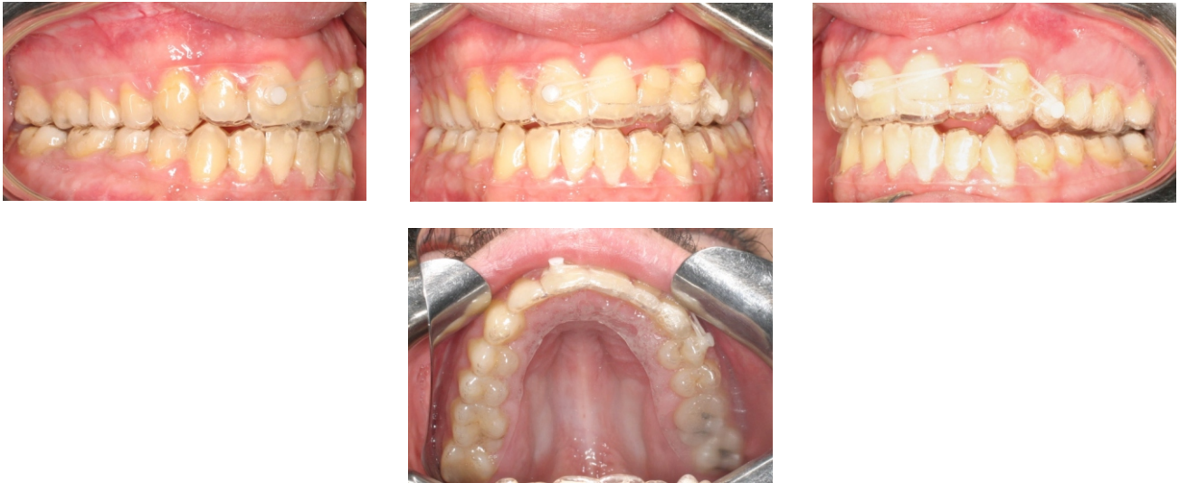
Figuras 40-43. CA Clear Aligner Forced extrusion con botones CA de plástico, CA Power Grip 1 and elásticos 3/16" y 4,5 oz.