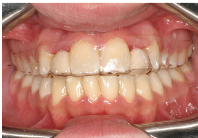
Figura 32. CA Clear Aligner com mantenedor de espacio.