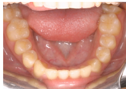
Figuras 54-58. Fotografías finales.