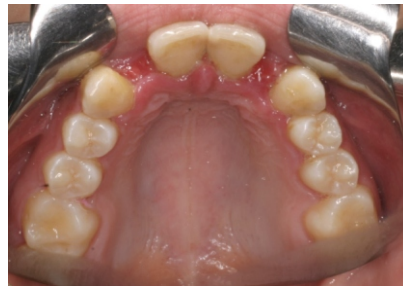
Figuras 28-31. Fotografías iniciales.