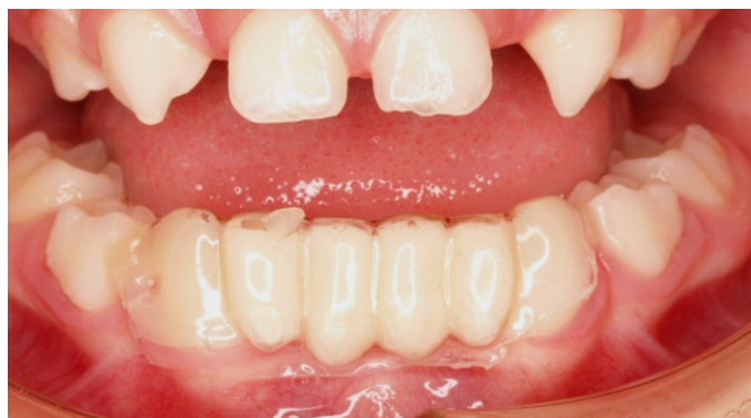
Figura 27. CA Clear Aligner como mantenedor de espacio