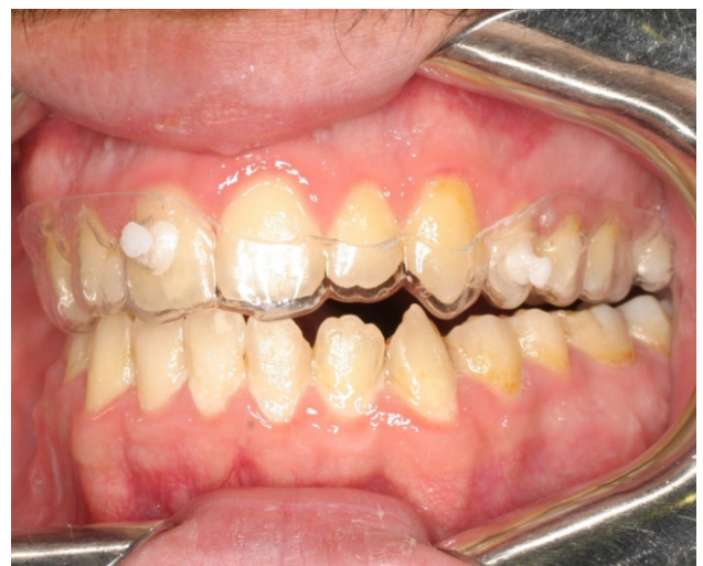
Figures 38-39. CA Clear Aligner Forced extrusion with CA Plastic buttons