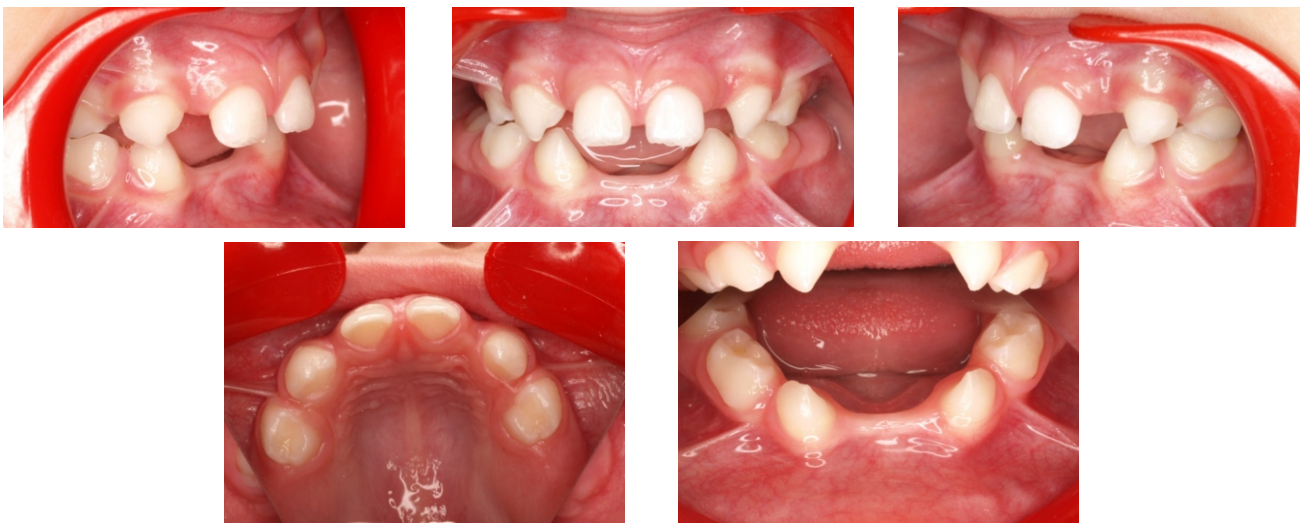
Figuras 21-25. Fotografías iniciales.

Missing lower incisors in a 3-year old patient. CA Clear Aligner is used as space maintainer.