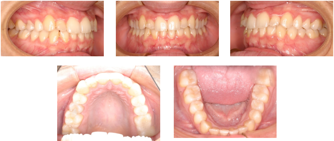
Figuras 6-10. Power Grip 1 en el incisivo lateral superior.